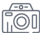
Sklepik z pamiątkami

7) Zdajemy sobie sprawę, iż nasz Park cieszy się ogromną popularnością wśród zwiedzających, dlatego też staramy się poszerzać naszą ofertę o nowe atrakcje – kilka rocznie. Prosimy jednak pamiętać, że niektóre z nich, ze względu na odczucia jakich doznajemy wewnątrz danej atrakcji oraz specyfikę wykonania - mają ograniczoną dzienną przepustowość.